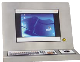
Abbildung Beschreibung Abmessungen in mm Bestellnummer