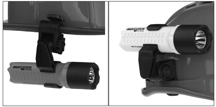
XPP-5418 with Brim Mount